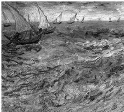
Vincent van Gogh, Saintes-Maries